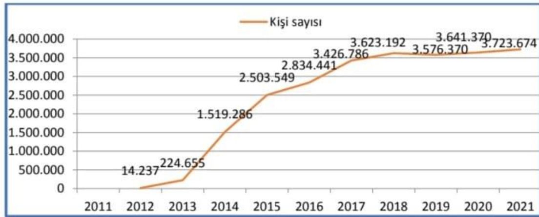
Şekil 1. Yıllara Göre Geçici Koruma Kapsamındaki Suriyeli Sayısı (Göç İdaresi Genel Müdürlüğü [GİGM], 2021)

ABD merkezli Pew araştırma şirketine göre 2011 yılından beri devam eden iç savaş nedeniyle 13 milyon Suriyeli evlerini terk etti. 5 Göç etmek zorunda kalan 6 milyon Suriyeli vatandaş ülke içine göçtü, 5 milyondan fazlası Ortadoğu'daki komşu ülkelere gitti. En çok Suriyeli sığınmacıyı kabul eden ülke ise Türkiye oldu. 6 Suriye'de yaşanan sığınmacı krizinde Türkiye'nin attığı adımlar, sağladığı maddi ve manevi desteğin bir parçası olarak Türkiye, açık kapı politikasını uygulamıştır ve Suriye uyruklu göçmenleri geçici koruma altına almıştır. Geçici koruma sonucunda ise Türkiye'de 10 ilde geçici barınma merkezleri kurulmuştur ve bu merkezlerin koordinasyonu AFAD tarafından sağlanmaktadır. Geçici barınma merkezlerinde vatandaşların güvenlik, sağlık, eğitim, gibi pek çok insani ihtiyaçları sağlanmaktadır. Suriye'de iç savaşın devam etmesi sonucu Suriyelilerin Türkiye'de kalma süreleri artmıştır ve sosyal uyum süreci başlamıştır, geçici barınma merkezlerinin dışında çeşitli illerde yaşayan sığınmacıların sayısı da oldukça yüksektir ve bu sayı artış göstermektedir. Şekil 1'de de görüldüğü üzere Türkiye'de yaşayan Suriye uyruklu sığınmacı sayısı günden güne artmaktadır.