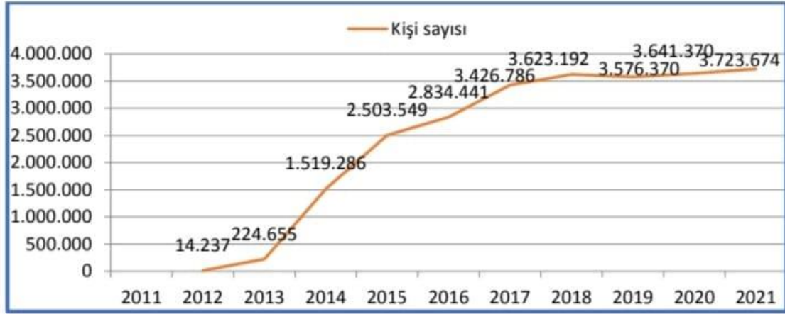
Şekil 1. Yıllara Göre Geçici Koruma Kapsamındaki Suriyeli Sayısı (Göç İdaresi Genel Müdürlüğü [GİGM], 2021)

Türkiye'nin attığı adımlar, sağladığı maddi ve manevi desteğin bir parçası olarak Türkiye, açık kapı politikasını uygulamıştır ve Suriye uyruklu göçmenleri geçici koruma altına almıştır. Geçici koruma sonucunda ise Türkiye'de 10 ilde geçici barınma merkezleri kurulmuştur ve bu merkezlerin koordinasyonu AFAD tarafından sağlanmaktadır. Geçici barınma merkezlerinde vatandaşların güvenlik, sağlık, eğitim, gibi pek çok insani ihtiyaçları sağlanmaktadır. Suriye'de iç savaşın devam etmesi sonucu Suriyelilerin Türkiye'de kalma süreleri artmıştır ve sosyal uyum süreci başlamıştır, geçici barınma merkezlerinin dışında çeşitli illerde yaşayan sığınmacıların sayısı da oldukça yüksektir ve bu sayı artış göstermektedir. Şekil 1'de de görüldüğü üzere Türkiye'de yaşayan Suriye uyruklu sığınmacı sayısı günden güne artmaktadır.